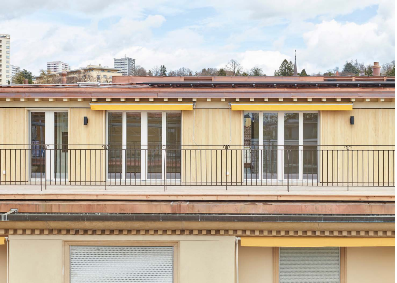
Immeuble sis Avenue de Béthusy 82-84 à Lausanne, détail de la façade sud-ouest de l'attique.