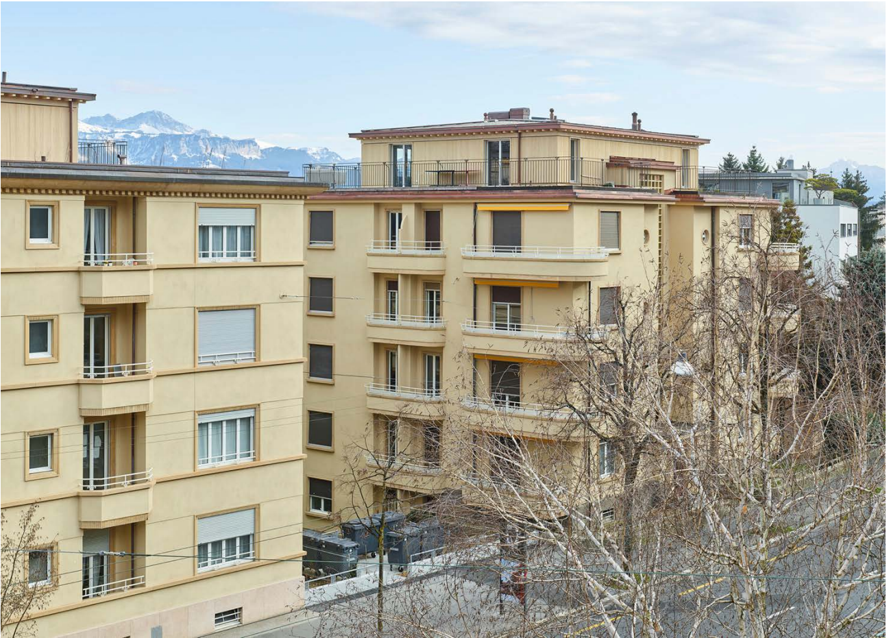
Immeubles sis Avenue de Béthusy 80-84 à Lausanne, façades nord-ouest et nord-est.

En conclusion, la commission a relevé que la démarche du bureau Bunq s'inscrit ici dans une logique d'amélioration incrémentale, cohérente avec l'esprit de la LAT, favorisant des transformations progressives, qualitatives et socialement acceptables. La commission reconnaît aussi un exemple abouti de transformation et de densification du bâti existant, répondant de manière convaincante aux critères de densification, de patrimoine et de représentativité annoncé dans l'appel à candidatures. Par la justesse de ses choix, la qualité de son exécution et son attention portée au contexte, le projet démontre qu'une mise en œuvre exigeante des objectifs de la LAT peut se traduire par des réalisations concrètes et qualitatives. À ce titre, les immeubles sis Avenue de Béthusy 80-84 à Lausanne incarnent pleinement les valeurs portées par la Distinction vaudoise de Patrimoine suisse.