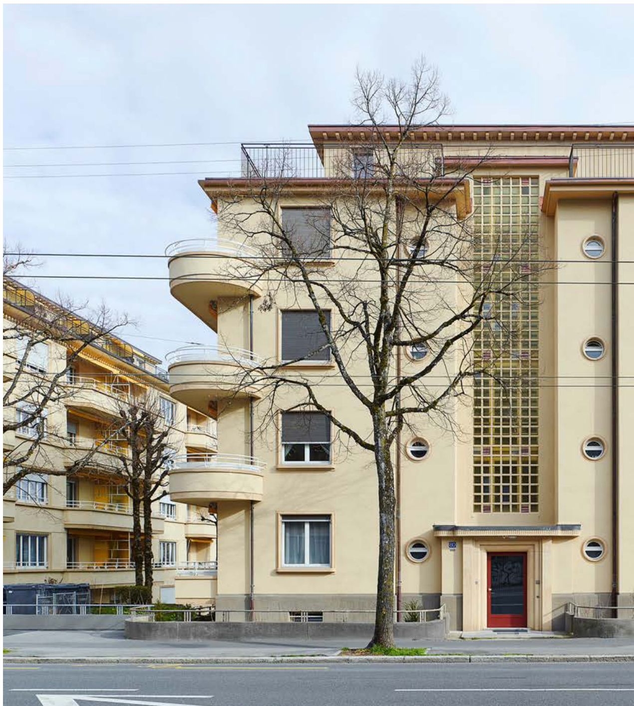
Immeuble sis Avenue de Béthusy 80 à Lausanne, façade nord-ouest.