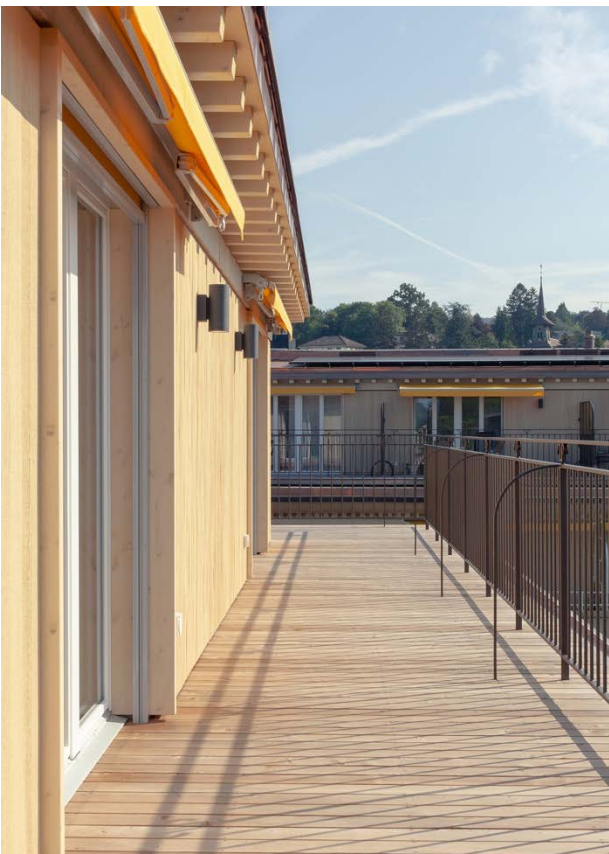
Immeuble sis Av. de Béthusy 80, attique (Rémi Mauduit).