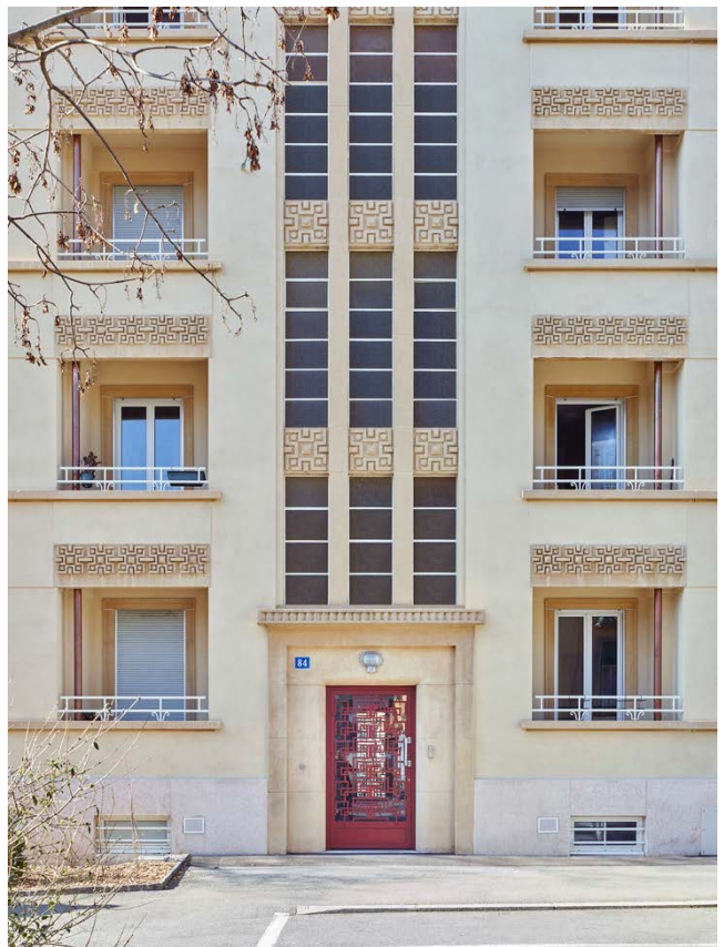
Immeuble sis Av. de Béthusy 84, entrée (D. Gagnebin De Bons).