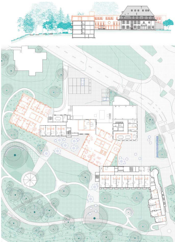
Fondation Louis Boissonnet, concours, plan RDC sup. (detritus.)

En conclusion, la commission reconnaît une contribution conceptuelle forte et stimulante au débat sur la transformation du bâti existant. Bien que son caractère encore prospectif ne permette pas une distinction fondée sur la réalisation, la démarche a été jugée suffisamment pertinente, cohérente et engagée pour faire l'objet d'une nomination.