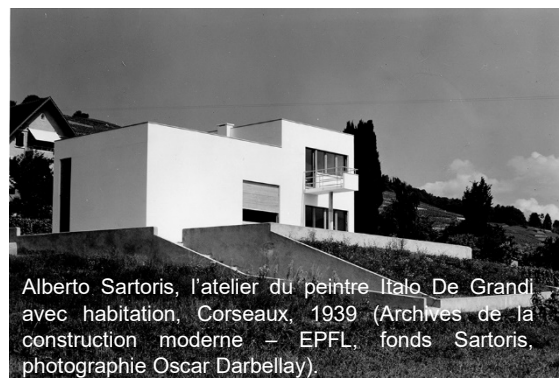
Alberto Sartoris, l'atelier du peintre Italo De Grandi avec habitation, Corseaux, 1939 (Archives de la construction moderne – EPFL, fonds Sartoris, photographie Oscar Darbellay).

Sur la colline de Corseaux, parmi de nombreuses habitations familiales se démarque la villa-atelier construite pour le peintre veveysan d'origine piémontaise, Italo De Grandi. Emblème remarquable de l'architecture fonctionnelle et rationnelle du style international sur la Riviera vaudoise, elle a été réalisée en 1939 par Alberto Sartoris, lui aussi piémontais d'origine.